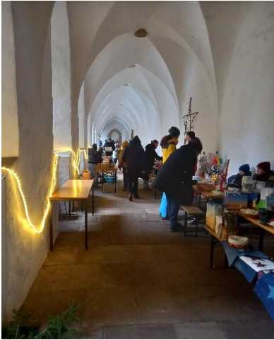
Adventsbasar im Kreuzgang – gemeinsam mit dem Heimatverein